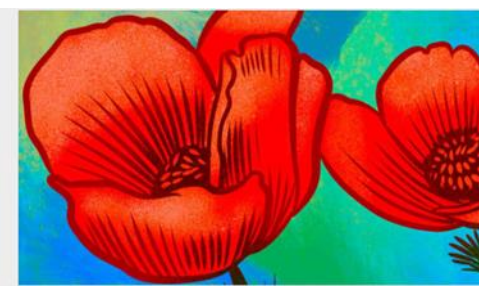
Calanit ( Anemone coronaria ), flor emblemática de Israel.

En el Mural, el diálogo cultural Colombia-Israel se refleja a través de elementos naturales referidos a la flora de ambos países más símbolos arquitectónicos e históricos de la ciudad de Ramle.